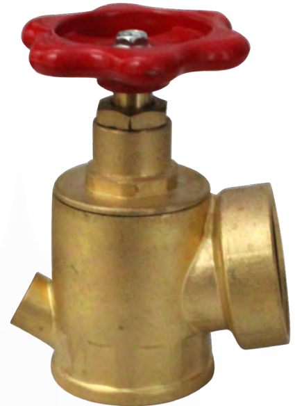
FIGURA 1: Dimensiones.