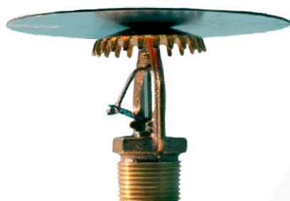
Montante con placa antiagua instalado de fábrica

Los sprinklers montante y colgantes Reliable modelo GL112 son sprinklers de respuesta rápida de cobertura estándar que utilizan un elemento térmico de enlace de soldadura con fusible de palanca en el rango de temperatura 74°C (165°F) o 100°C (212°F). Estos sprinklers están diseñados para su uso en lugares de almacenamiento y no almacenamiento de área de densidad con modelo de control (CMDA) calculados hidráulicamente de acuerdo con las curvas de área/densidad de NFPA 13 u otras normas aplicables.