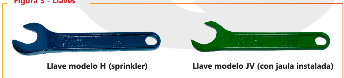
Figura 3 - Llaves

La falta de un mantenimiento adecuado de los sprinklers podría provocar un funcionamiento accidental o el no funcionamiento durante un incendio.