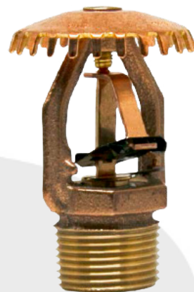
Figura 1 - Dimensiones y componentes del modelo GL112 montante