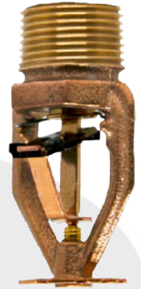
Figura 2 - Dimensiones y componentes del modelo GL112 colgante